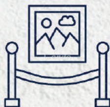
Sala de Exposições Exhibition Hall