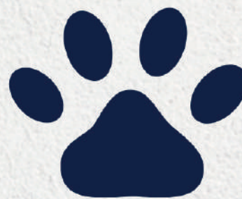
Permitidos Animais Pet Friendly