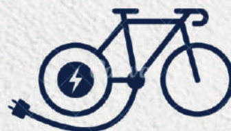
Bicicletas Elétricas Electric Bicycles