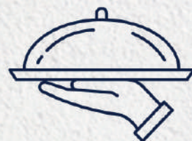
Serviço de Quartos Room Service