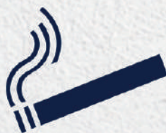
Venda de Tabaco & Espaço fumadores Cigarette Sale & Smoking area