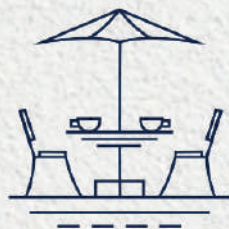
Esplanada Panorâmica Panoramic Terrace