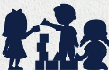
Espaço Crianças Children's Space