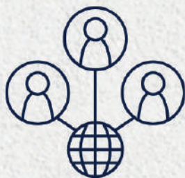
Espaço Network Network Space