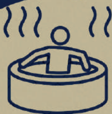
Jacuzzi Panorâmico Panoramic Jacuzzi